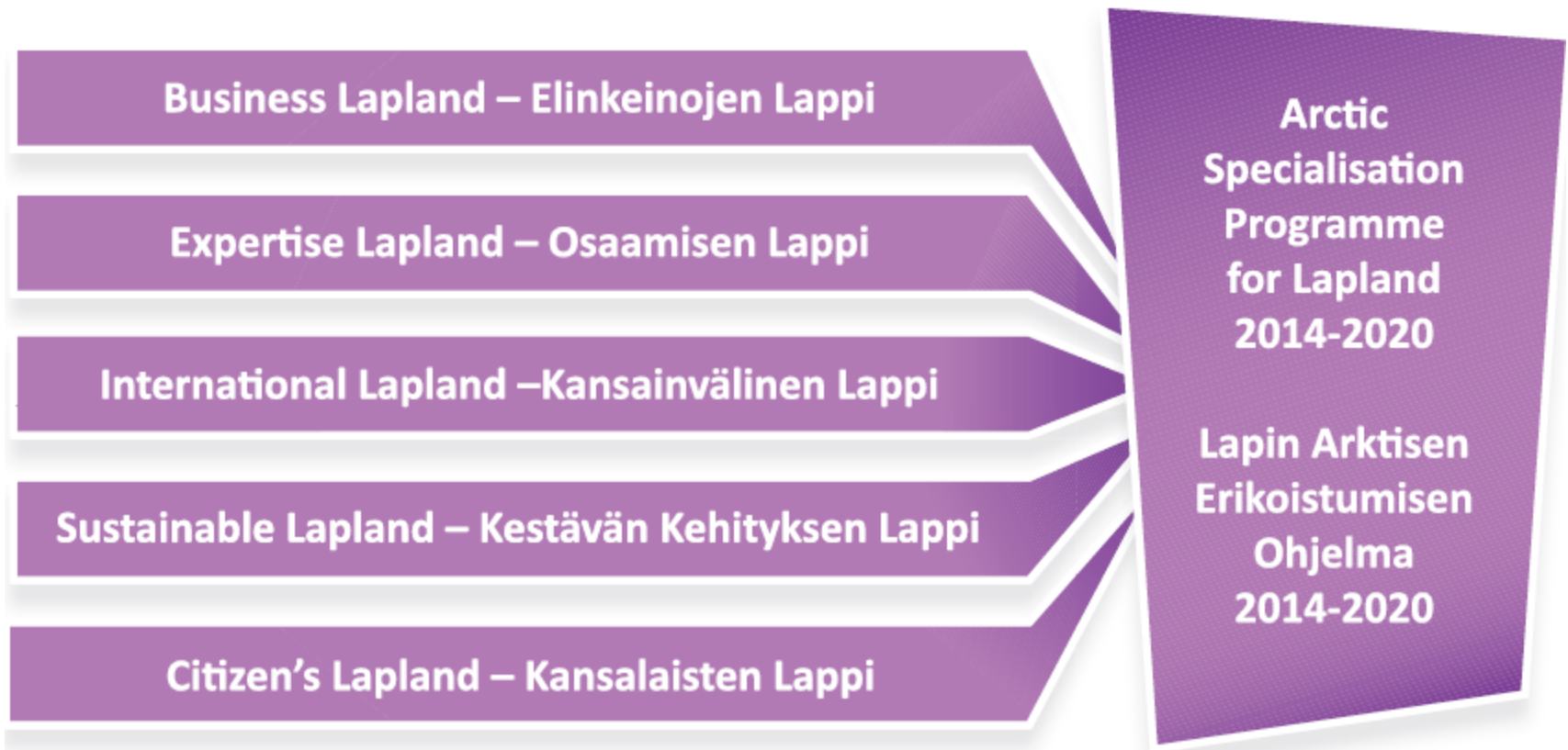
Kuva 2: Lappi arktisena osaajana ja toimijana / Lapin arktinen ohjelma