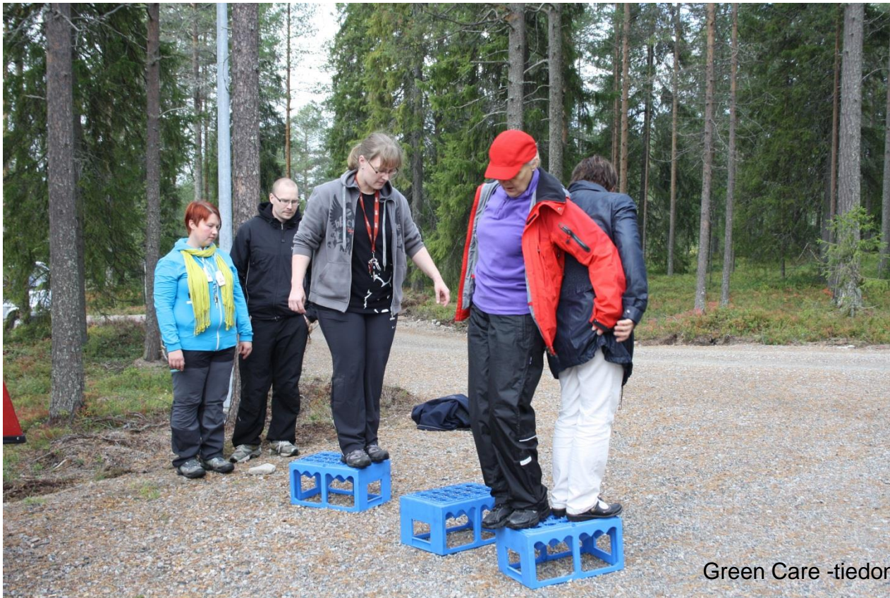
Green Care -tiedonvälityshanke