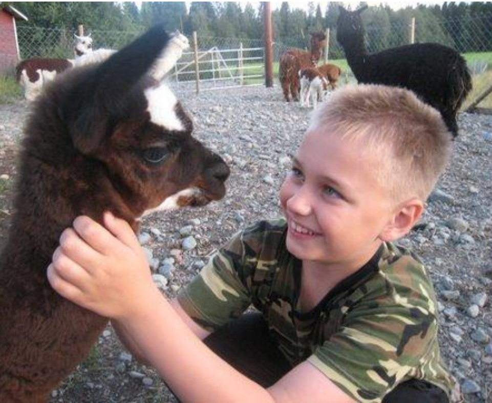
Ylitalon alpakat ja laamat