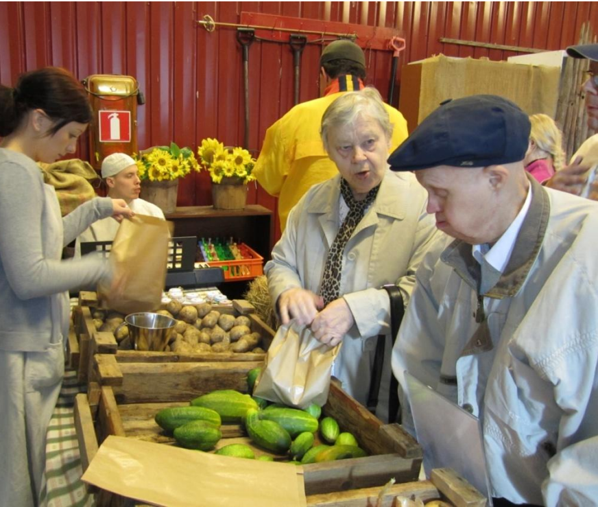
Sadonkorjuujuhla Hakamaan tilalla